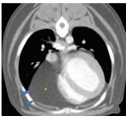
Imagen 2. Acumulación de tejido adiposo (flecha azul) en el saco pericárdico (cabezas de flechas).

Se amplía con pruebas de imagen avanzadas, por lo que se realiza un TAC (Imagen 2 y 3), en el cual se observa una acumulación de tejido homogéneo en el saco pericárdico, rodeando el corazón, par-